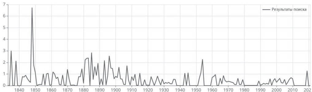
Схема 1. Частотность прилагательного «недюжинный» по годам

Исследуемое прилагательное может употребляться непосредственно с лексемой человек , хотя такое употребление встречается довольно редко: «И так просторечно и одновременно аристократично из этих, кажется, интеллигентных самих по себе уст прозвучала эта искра поддержки, что на сердце стало как-то легко и спокойно. Что и говорить: недюжинный человек » [ https://m-kozhaev.ru/son-50/ ]. При этом возможна инверсия, которая выполняет функцию усиления: «Отец мой Георгий Иванович, человек недюжинный , фантазер, одаренный редкой способностью внушать свои идеи, доморощенный философ, был смолodu яркий революцио-