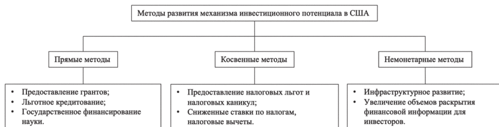
Рис. 2. Методы развития механизма инвестиционного потенциала США