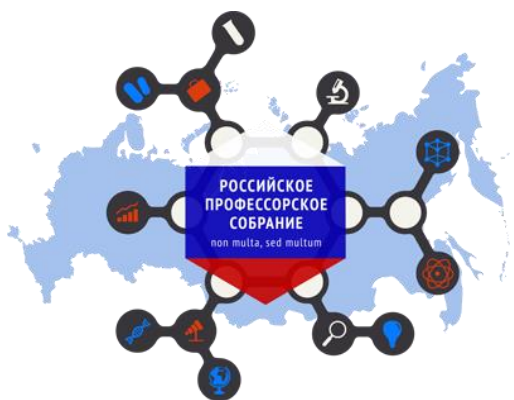
Российское профессорское собрание