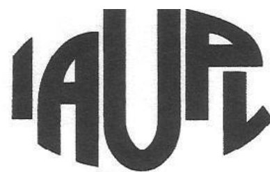
Международная ассоциация профессорско-преподавательского состава университетов